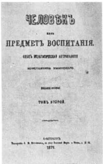
Издания трудов К. Д. Ушинского 70-х гг. и его фотография 50-х гг.